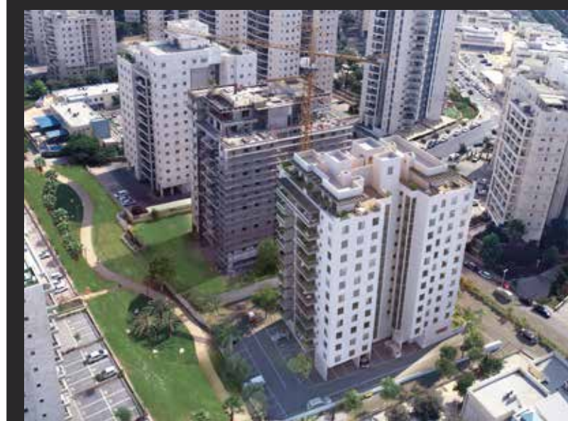
הדמיית המחשה בלבד