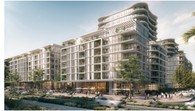
EVE | נוה גן, רמת השרון