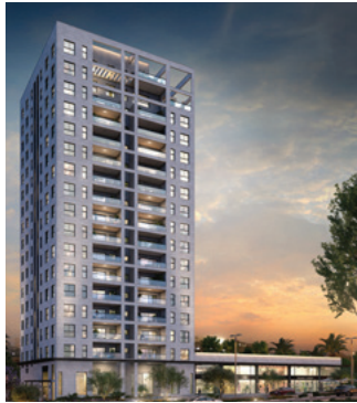
א-בגבעה | גבעת שמואל