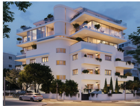
א-רוטשילד 67 | תל אביב