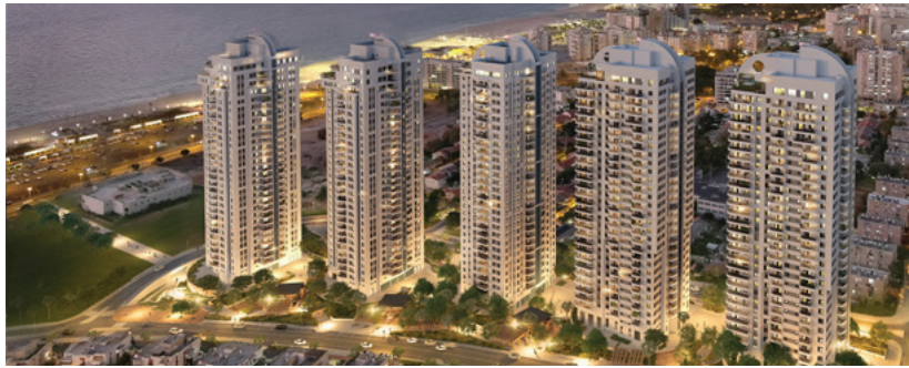
מגדלי הדקל | קו ראשון לים באשדוד