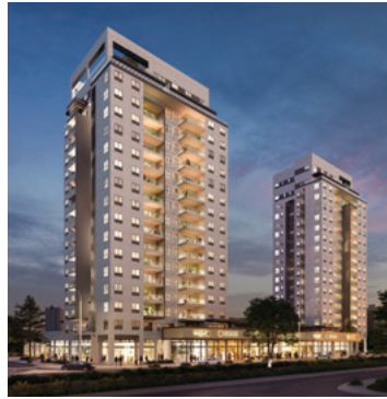
א-עיר היין | אשקלון