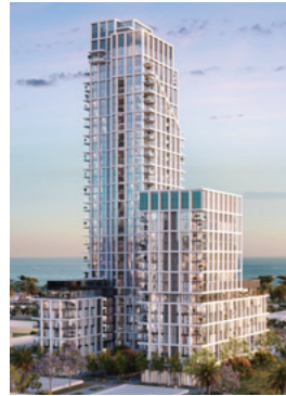
UTOPIA | שדה דב, ת"א