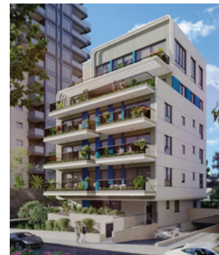
א-ריינס 5 | גבעתיים