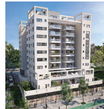
א-רמת אפעל | רמת גן

המוצג בחוברת זו, לרבות תמונות, הדמיות, מימדים, ריהוט, מוצרי חשמל, אביזרי סטיילינג, ריצוף, לרבות ריצוף עץ (דקים), הינם לצורך המחשה בלבד. חוברת זו כוללת הצעות עיצוב, שדרוגים ובחירת חומרי גלם, אשר אינם מהווים חלק מהתוכנית ו/או המפרט הטכני שיצורפו לחוזה המכר אשר יחתם בין הקונה לחברה, והם בלבד יחייבו את החברה. טל.ח. 264.2026