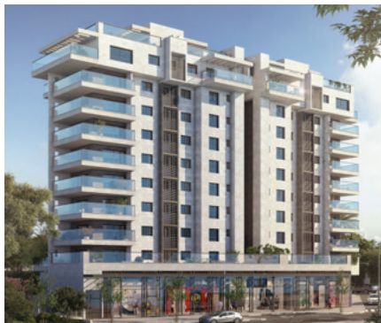
א-נוף השרון | נתניה