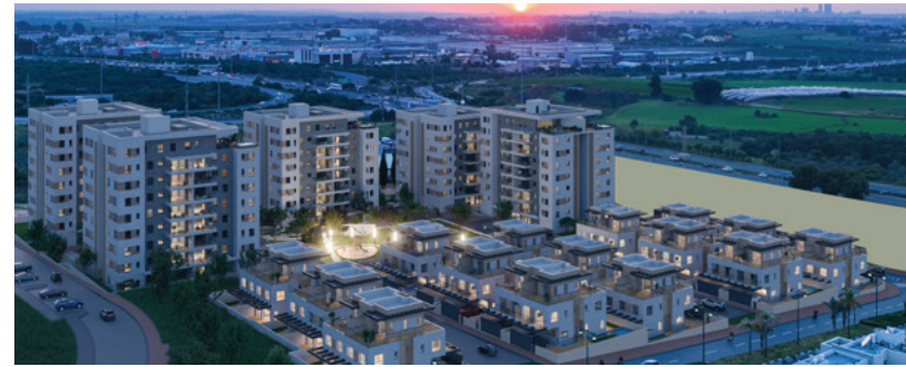
Boutique | השכונה הפרטית במושבה